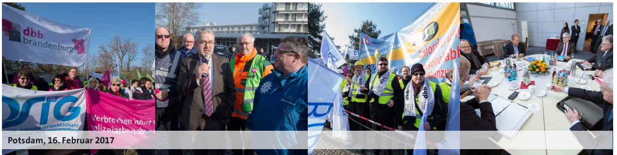
Potsdam, 16. Februar 2017