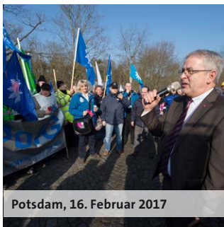
Potsdam, 16. Februar 2017