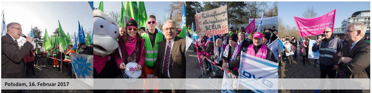
Potsdam, 16. Februar 2017

ausgesetzt. Die Tarifvertragsparteien werden nach Abschluss der Redaktionsverhandlungen zur Entgeltrunde die Gespräche zu strukturellen Fragen der Entgeltordnung fortsetzen.“ Die Antragsfristen bei Ansprüchen auf Höhergruppierung, Entgeltgruppenzulage und Angleichungszulage aus Anlass des Inkrafttretens der EGO-Lehrkräfte werden verlängert.